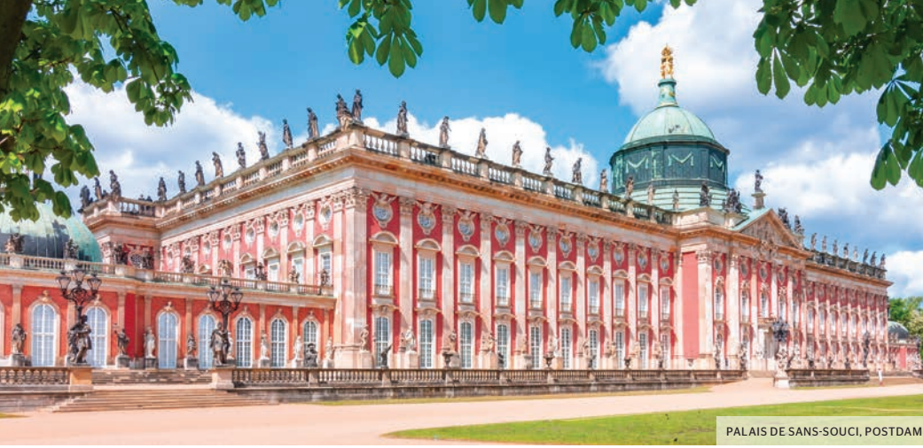
PALAIS DE SANS-SOUCI, POSTDAM