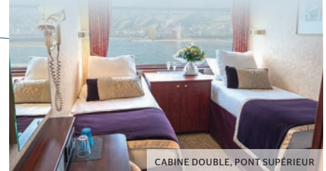
CABINE DOUBLE, PONT SUPÉRIEUR